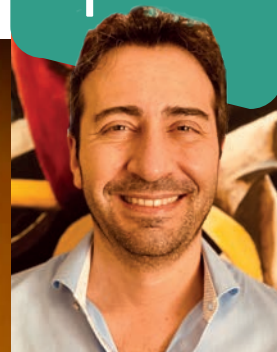
MATTEO TURCONI SORMANI Assessore al Territorio e Lavori Pubblici

L a Giubiana, con il suo suggestivo rogo, insieme al falò di Sant'Antonio, rappresenta uno degli esempi più vivi e significativi di patrimonio culturale immateriale della Brianza, radicato in antiche tradizioni popolari che affondano le origini nel nostro passato contadino e comunitario.