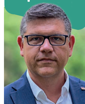
ATTILIO AMOROSO Presidente del Consiglio Comunale