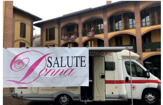
San Vito, patologie del seno con screening gratuito.

Domenica 13 ottobre , dalle 9.00 alle 17.00 in piazza