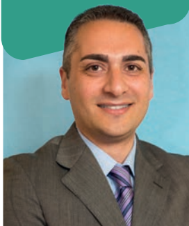
DOMENICO PANSERA Assessore alla Pubblica Istruzione